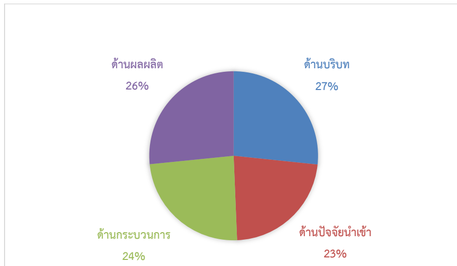
ภาพที่ 2 ภาพรวมความคิดเห็นของผู้บริหารสถานศึกษา และครูผู้สอนทักษะชีวิตที่มีต่อ โครงการเสริมสร้างนักเรียนแกนนำป้องกันเอดส์และเพศศึกษาในโรงเรียนสังกัดกรุงเทพมหานคร

ความคิดเห็นของผู้บริหารสถานศึกษา และครูผู้สอนทักษะชีวิตด้านเอดส์และเพศศึกษาทั้ง 4 ด้าน โดยภาพรวม พบว่า อยู่ในระดับเห็นด้วยมาก ( \bar{X}=4.43 , S.D.= 0.29) เมื่อพิจารณาในแต่ละด้าน พบว่า ค่าเฉลี่ยสูงสุด คือ ด้านบริบท ( \bar{X}= 4.72 , S.D.= 0.34) ซึ่งอยู่ในระดับเห็นด้วยมากที่สุด รองลงมาคือด้าน ผลผลิต ( \bar{X}= 4.71 , S.D.= 0.28) ซึ่งอยู่ในระดับเห็นด้วยมากที่สุด ส่วนค่าเฉลี่ยน้อยที่สุด คือ ด้านปัจจัย นำเข้า ( \bar{X}= 4.02 , S.D.= 0.26) ซึ่งอยู่ในระดับเห็นด้วยมาก ตามลำดับ