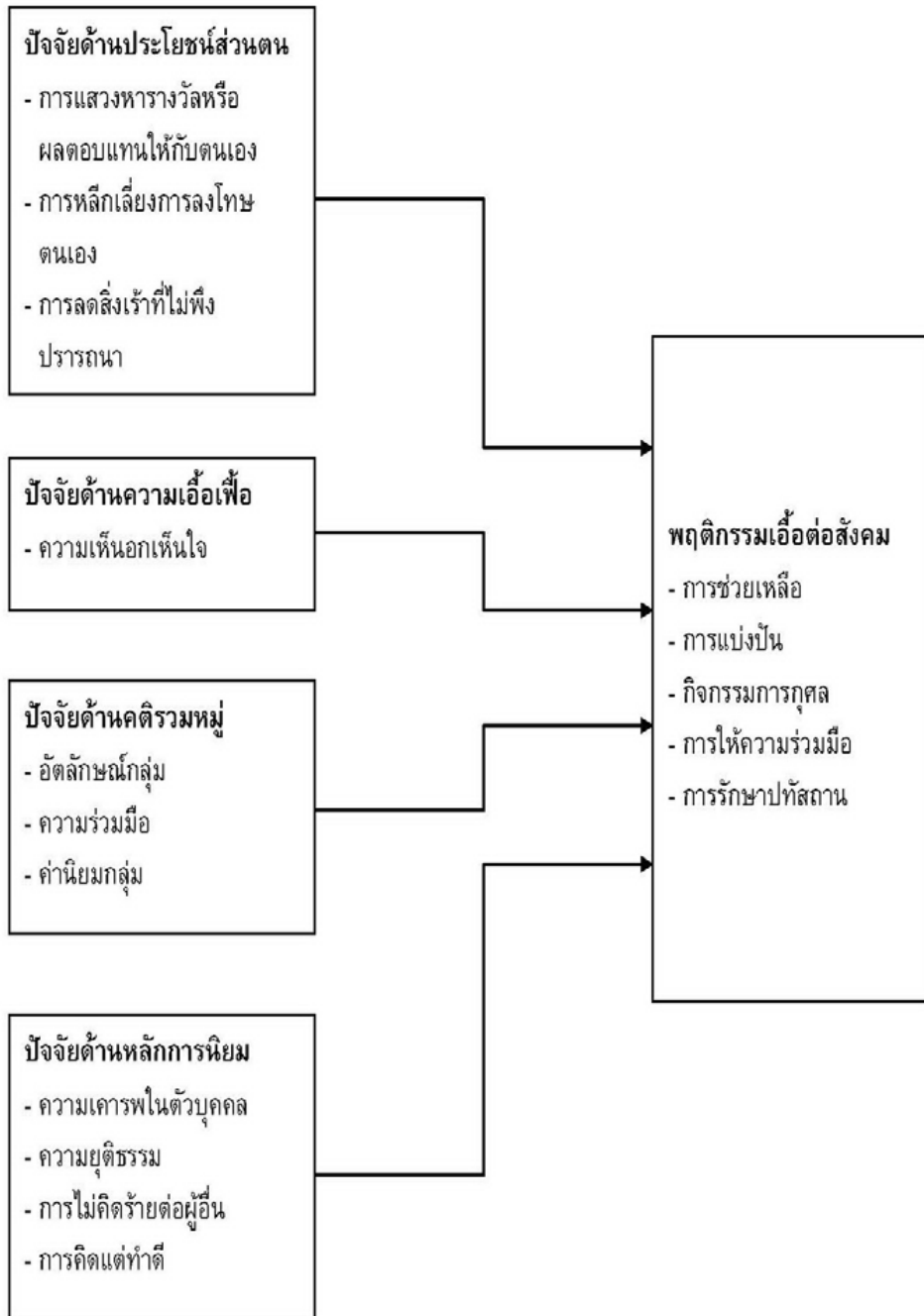
ภาพประกอบ 1 กรอบแนวคิดปัจจัยเชิงสาเหตุที่มีต่อพฤติกรรมเอื้อต่อสังคม ของนักเรียนอาชีวศึกษาเอกชน